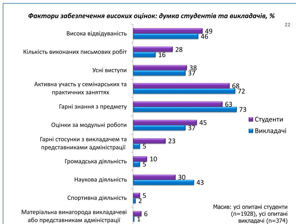
Рис. 1. Статус письмових робіт у навчальному процесі українських студентів.

фізична присутність студента на занятті насправді взагалі нічого не означає з точки зору засвоєння матеріалу! Письмові роботи «важать» менше за «взагалі-не-критерій» роботи студента! Ця ситуація, на мою думку, потребує окремого ґрунтовного аналізу.